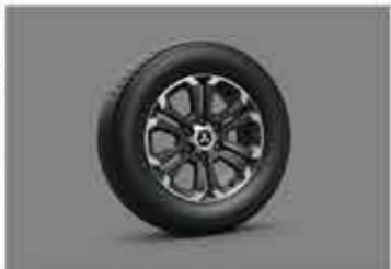
BARU 18" Alloy Wheels 1