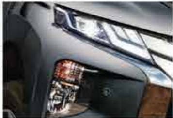
Sharp Look LED Headlamp with DRL