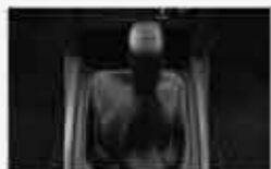
6-Speed Manual Transmission 2

*MIVEC (Mitsubishi Innovate Valve timing Electronic Control System)