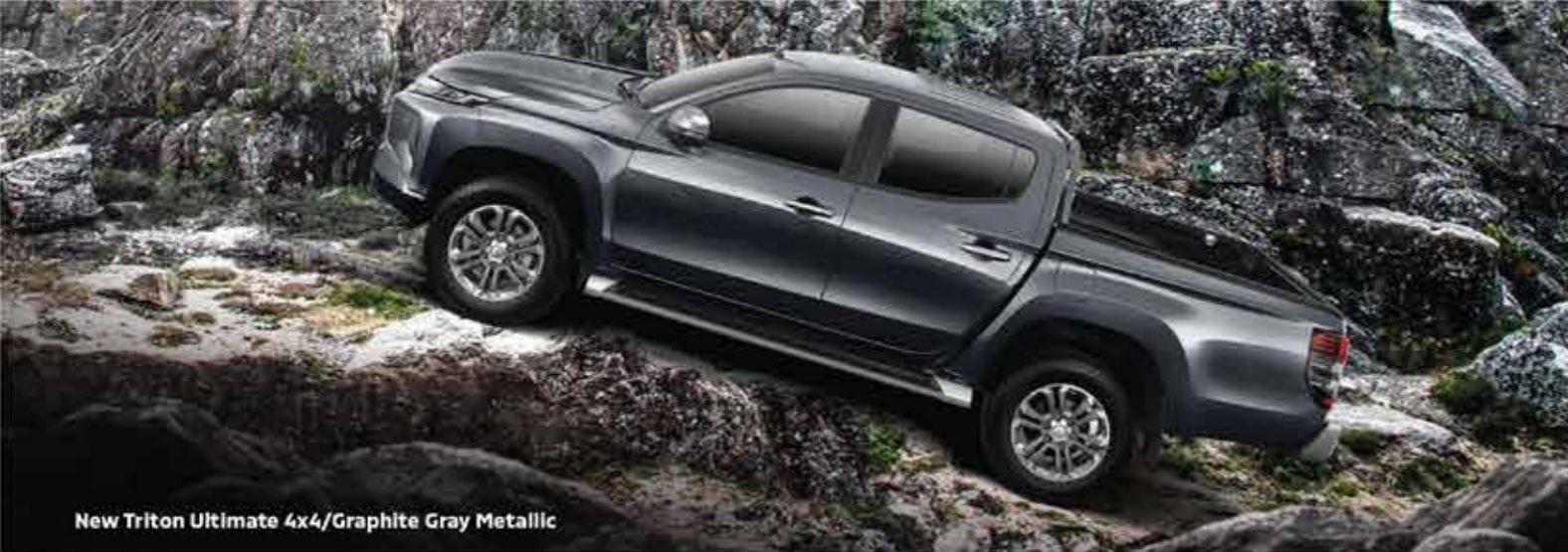
New Triton Ultimate 4x4/Graphite Gray Metallic