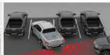
BARU Rear Cross Traffic Alert [RCTA] 1

Untuk meningkatkan keselamatan dan kenyamanan berkendara di malam hari, lampu high beam berubah otomatis menjadi low beam saat mendeteksi kendaraan lain di depan, tanpa perlu melepas kemudi.