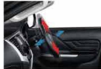
Tilt & Telescopic Steering