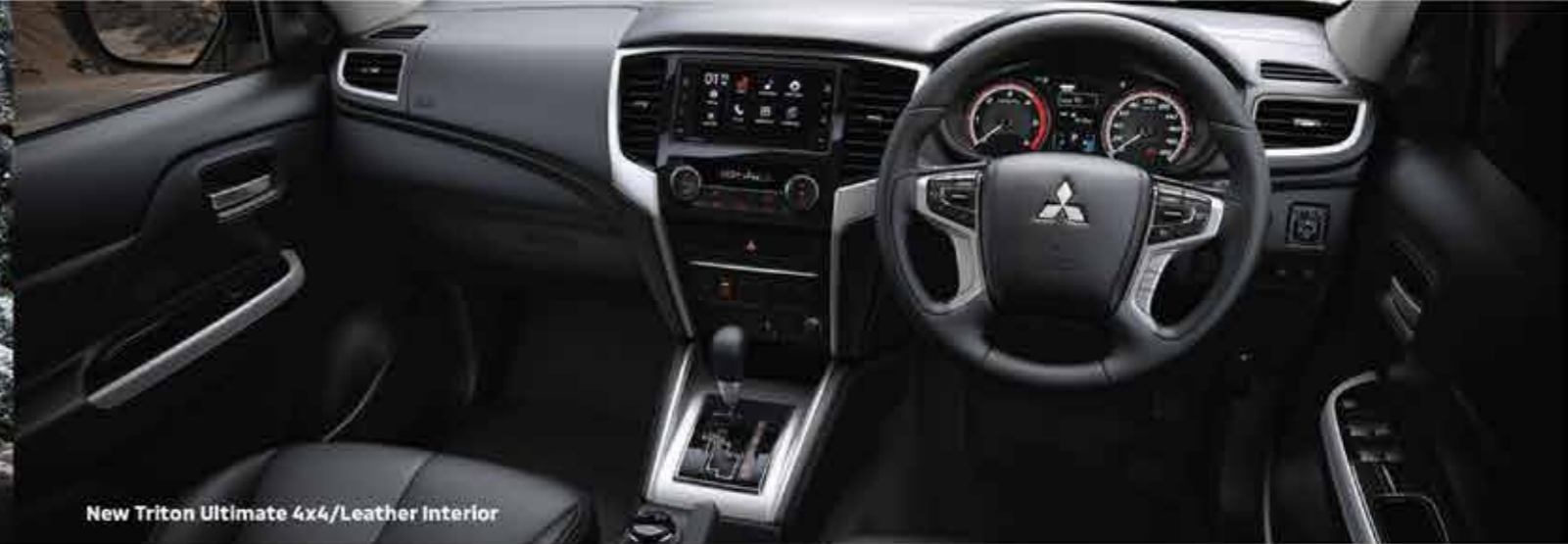
New Triton Ultimate 4x4/Leather Interior