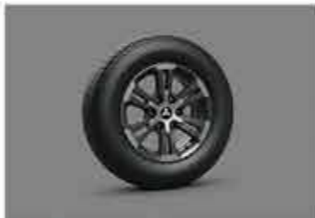
BARU 17" Alloy Wheels 2