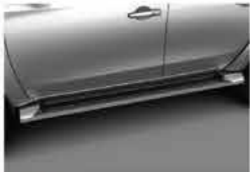
BARU Side Steps