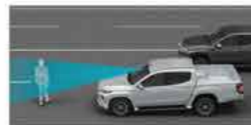
BARU Forward Collision Mitigation System [FCM] 1

Membantu pencegahan benturan depan, atau meminimalkan dampaknya jika benturan tak dapat dihindari. Fitur ini mendeteksi kendaraan lain dan pejalan kaki melalui kamera dan radar laser.