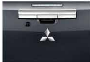
Chrome Rear Gate Handle