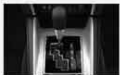
6-Speed Automatic Transmission with Sport Mode

Mesin diesel MIVEC meningkatkan efisiensi bahan bakar dan secara signifikan mengurangi emisi CO 2 . Mesin ini menghasilkan respon power 181 PS (3500rpm) dan torsi 430N.m (2500rpm).