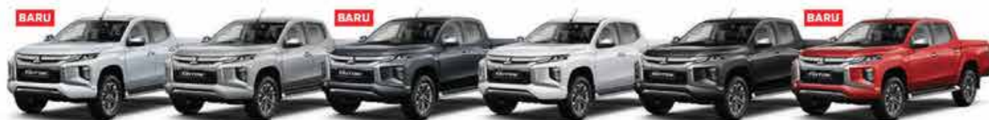
White Diamond (ULTIMATE)