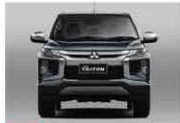
BARU Dynamic Shield Front Face Design