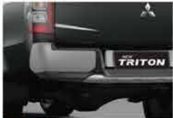
BARU Sturdy Rear Bumper