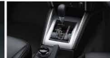
Modern Look Floor Console