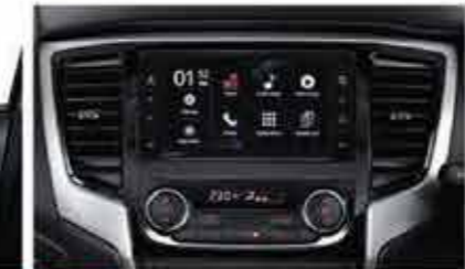
BARU Premium Wide 2 DIN Entertainment System/USB & MP3 Player (Smartphone Connectivity Feature)