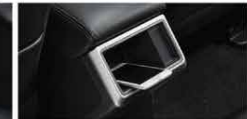
BARU Smartphone Tray for Rear Seat Passenger