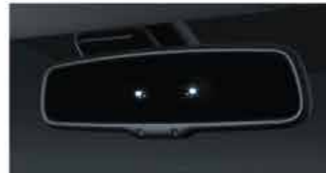
Auto Dimming Rearview Mirror 1 Cermin yang mengurangi pantulan lampu depan mobil belakang untuk pandangan belakang yang lebih jelas.