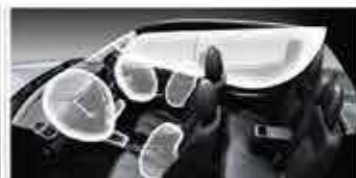
BARU 7 SRS Airbags 1

Indikator akan menyala di Combination Meter Display saat RCTA aktif. Jika sensor radar di bumper belakang mendeteksi kendaraan lain yang mendekati saat gigi mundur aktif, akan muncul peringatan di Multi-Information Display, dan indikator berkedip di kedua spion disertai bunyi buzzer.