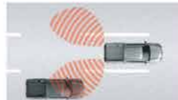
BARU Blind Spot Warning [BSW] 1

Membantu pencegahan benturan depan, atau meminimalkan dampaknya jika benturan tak dapat dihindari. Fitur ini mendeteksi kendaraan lain dan pejalan kaki melalui kamera dan radar laser.