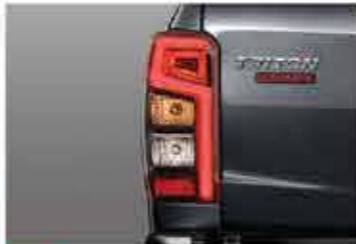
BARU LED Rear Combination Lamps