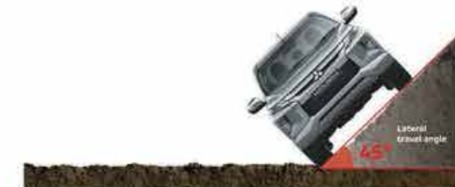
Lateral travel angle