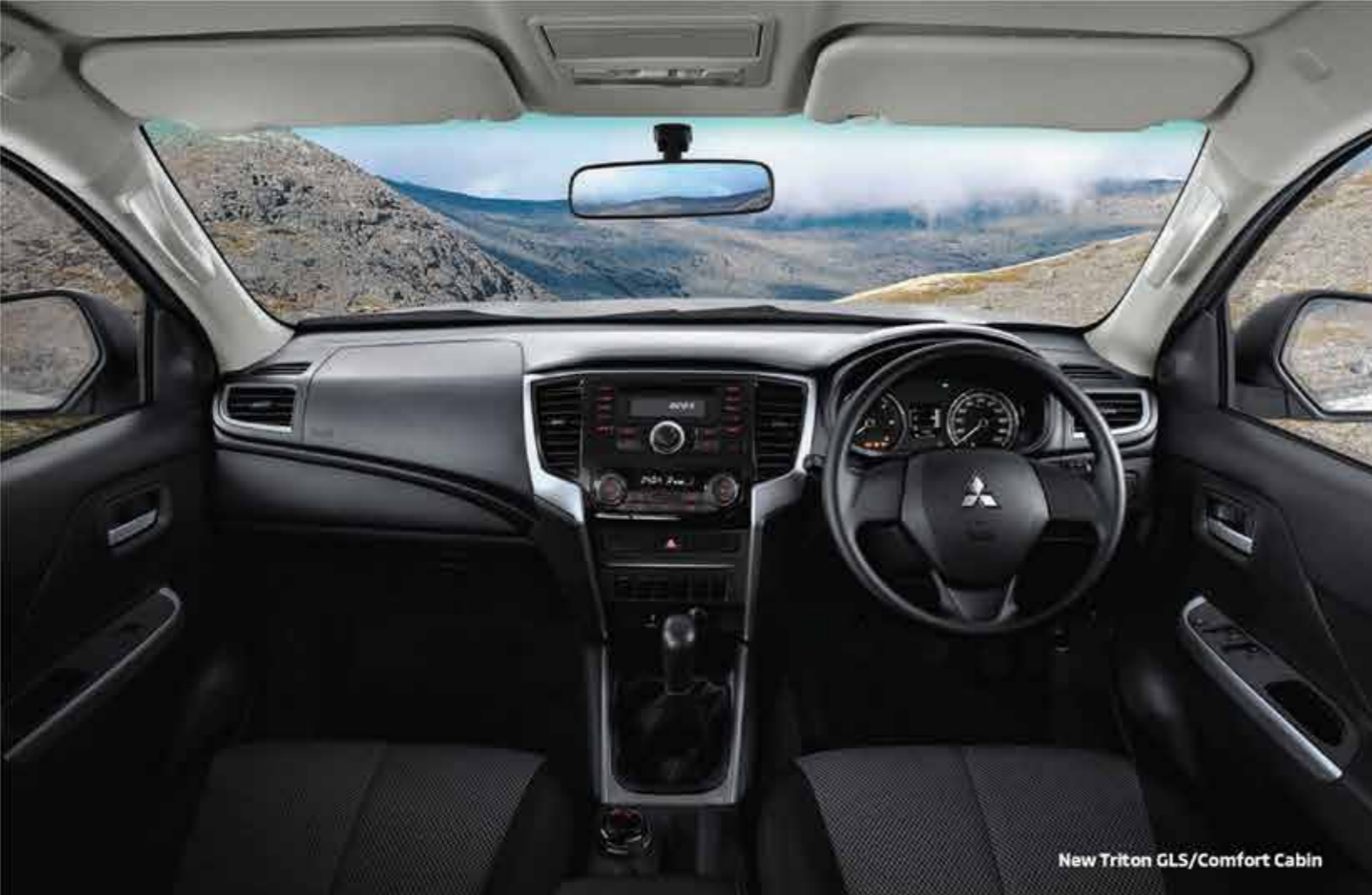
New Triton GLS/Comfort Cabin