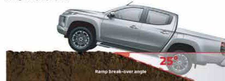
Ramp break-over angle

Pengalaman berkendara terus ditingkatkan, untuk membuat Triton siap melewati segala macam rintangan. Visibilitas saat berkendara semakin meningkat dengan diperbarainya desain kap mesin dan wiper, serta ban 265/60R18, side steps dan rear step bumper yang stylish, kini Anda siap menghadapi apa pun.