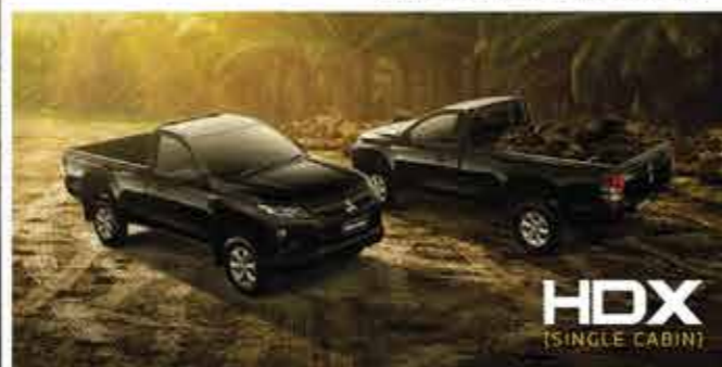
New Triton HDX Single Cabin/Jet Black Mica