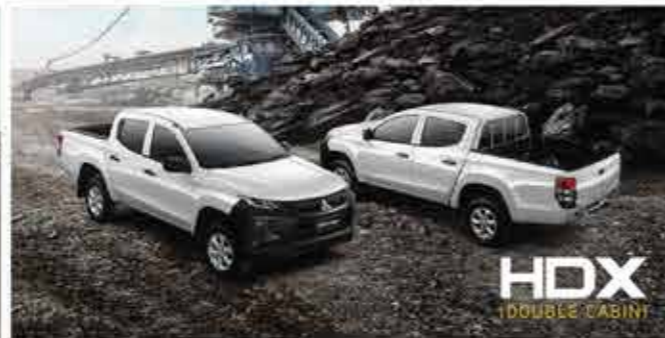
New Triton HDX Double Cabin/White Solid