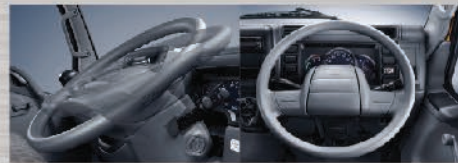
Tilt & Telescopic Steering Memudahkan dalam pengaturan posisi kemudi sesuai postur tubuh pengemudi.