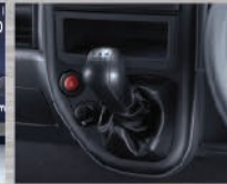
Mitsubishi In Dash Gear Shift Tuas transmisi menyatu dengan dashboard, kabin lega.