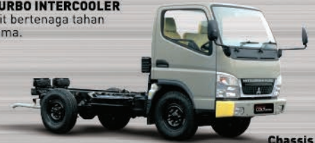
Chassis Chassis kokoh dan tangguh, menjadikannya lebih stabil.