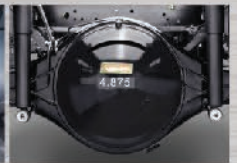
Gardan dibuat khusus kendaraan bus penumpang dengan tingkat kebisingan yang rendah.