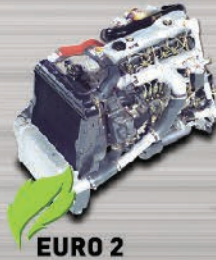
MESIN 4D34-2AT5 TURBO INTERCOOLER Irit bertenaga tahan lama.