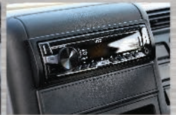
Radio/USB/MP3 Menambah kenyamanan di sepanjang perjalanan.