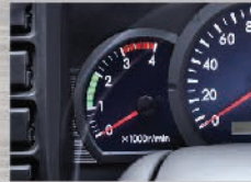
Tachometer Mempermudah penyesuaian putaran mesin dengan kecepatan kendaraan, agar irit BBM.