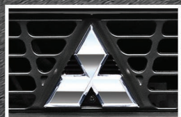
Chrome "Three Diamond" Mark